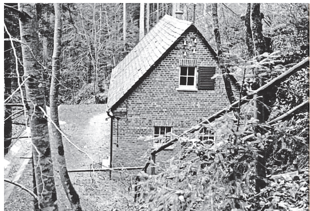
Die „Keimzelle“ der BWVG: Das alte Pumpenhaus in Witzmannsweiler aus dem Jahr 1929