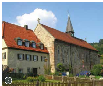
1 Blick auf Michelfeld